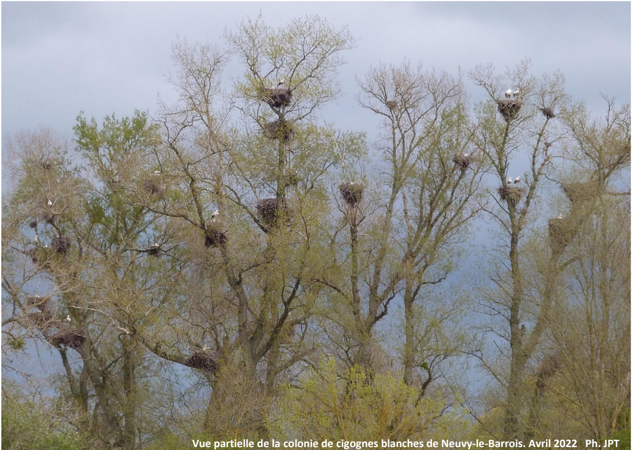
Vue partielle de la colonie de cigognes blanches de Neuvy-le-Barrois. Avril 2022