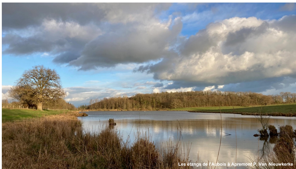
Les étangs de l'Aubois à Apremont P. Van Nieuwerkerke

Si les espèces d'oiseaux plongeurs (fuligules et grèbes) sont logiquement absentes en raison du gel, d'autres montrent une belle constance quelles que soient les conditions météorologiques. C'est le cas du Canard colvert, du Chipeau, de la Foulque macroule et de la Sarcelle d'hiver.